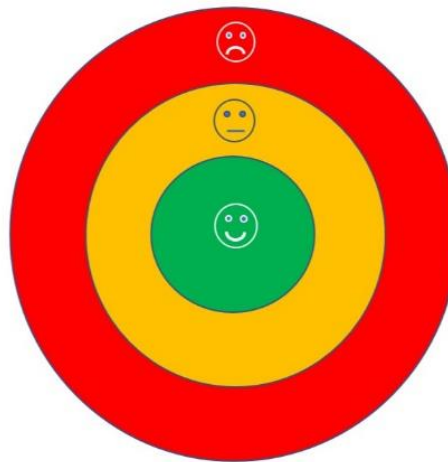
Beispiel des Ergänzungsmaterials 3-4 Jährige: Dreistufiger PEAP Teich

Beide Varianten des PEAP 2.5 können zusammen mit der Buchung eines jeweiligen PEAP-Kurses bestellt werden. Möglich ist auch die Bestellung beider Varianten ohne Kursteilnahme.